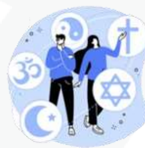
sua preferência religiosa

Agora fica fácil você compreender que o uso mal intencionado desses dados pode criar muitos problemas, como ocorre com os conhecidos golpes de boletos bancários, fraudes em contas de aplicativos, abertura indevida de contas bancárias e de consumo.