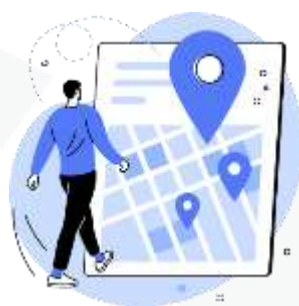
seus hábitos de deslocamento