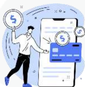
seus hábitos de consumo